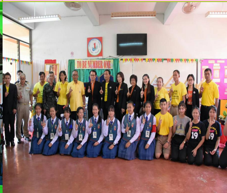
ชมรม TO BE NUMBER ONE ประเภทสถานประกอบการ