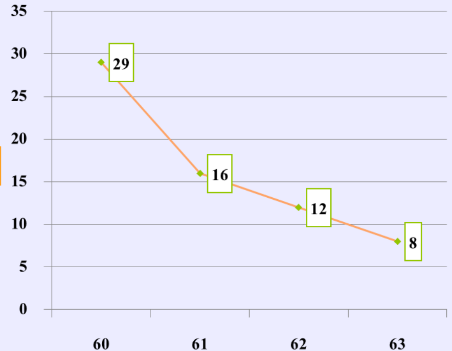
จำนวนหญิงตั้งครรภ์อายุน้อยกว่า 20 ปี (ตั้งครรภ์ซ้ำ)

— จำนวนหญิงตั้งครรภ์อายุน้อยกว่า 20 ปี (ตั้งครรภ์ซ้ำ)