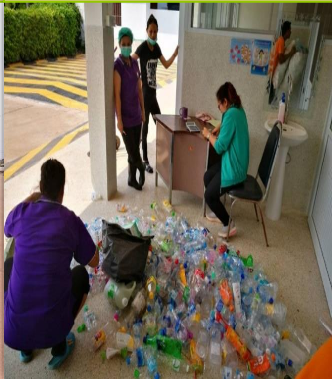
รพร. : ธนาคารขยะทองคำ